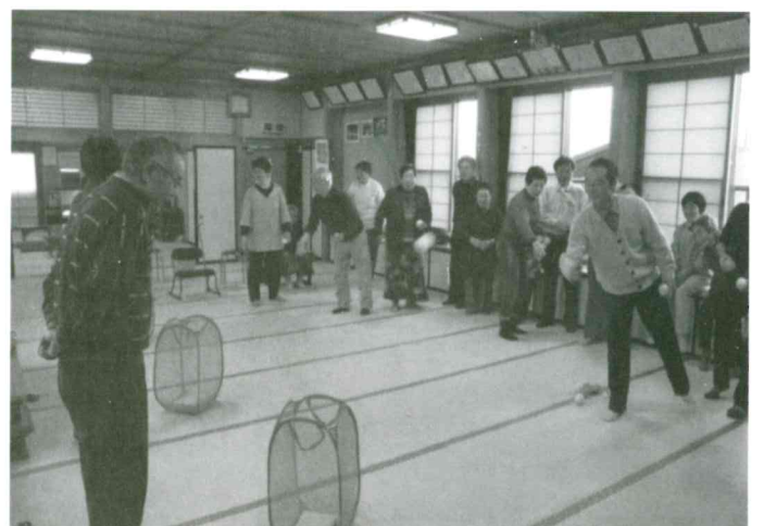
五日町 いきいきサロン 12月16日(水) チーム対抗ボール入れゲームを楽しみ、婦人会の方々の手料理かもち等で会食を行った。 参加者 25名