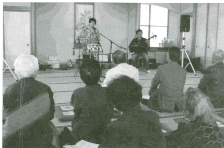
仲町 いきいきサロン 10月16日(木) 「民謡と三味線と尺八のかかし」による演奏を楽しんだ後仲町食改の皆さんが作った芋煮で昼食会を行った。 参加者 24名