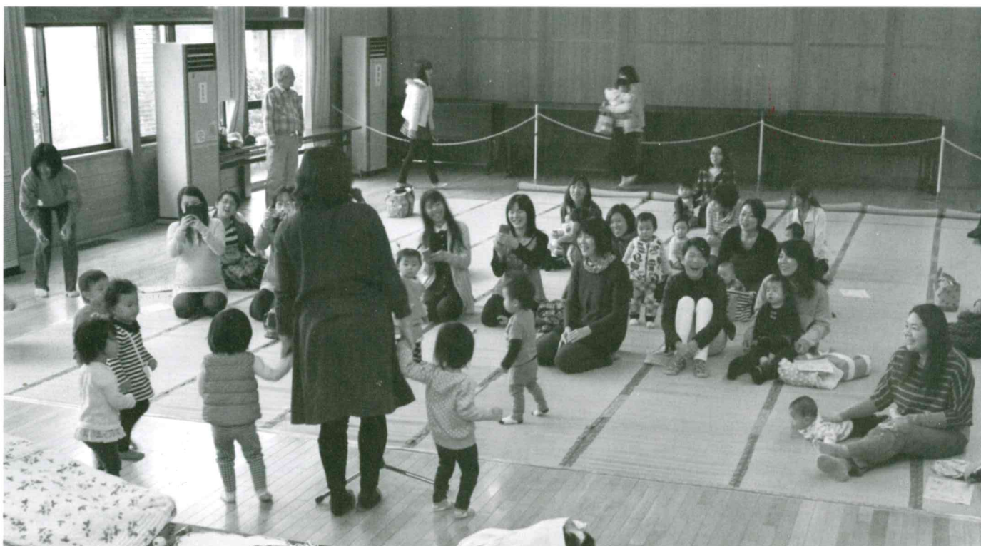
12月10日(木) 天童南部公民館共催事業 第2回 子育て支援事業「大好きママ」を開催。参加者 17組 34名