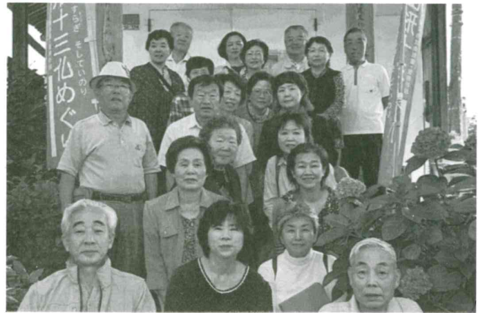
一日町「すこやか広場」 9月27日(日) 大石田乗船寺(釈迦涅槃像等)周辺を見学した後、深堀温泉で入浴と昼食会を行った。 参加者 22名