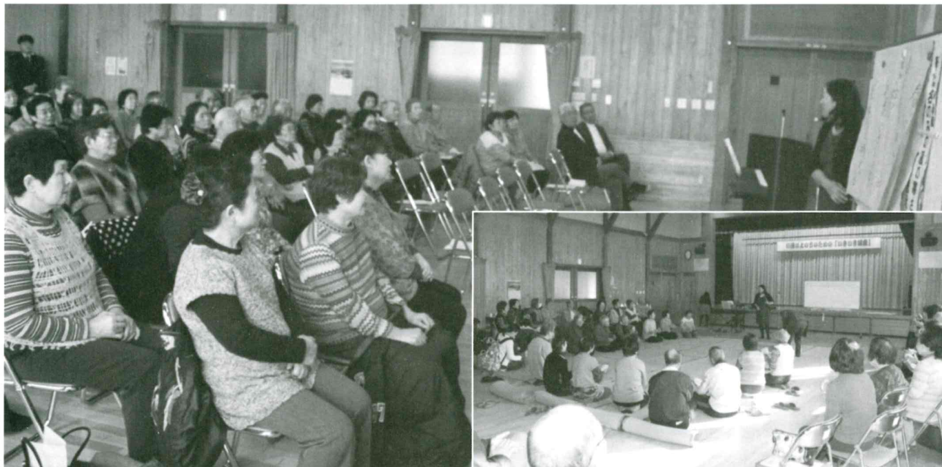
2月23日(火) 天童南部公民館共催事業 第3回 いきいき講座「音楽を聴き・歌いながら、心身の健康づくり」を開催。参加者 59名

2016年 3月15日号 発行 天童南部地域社会福祉協議会 TEL 656-9595