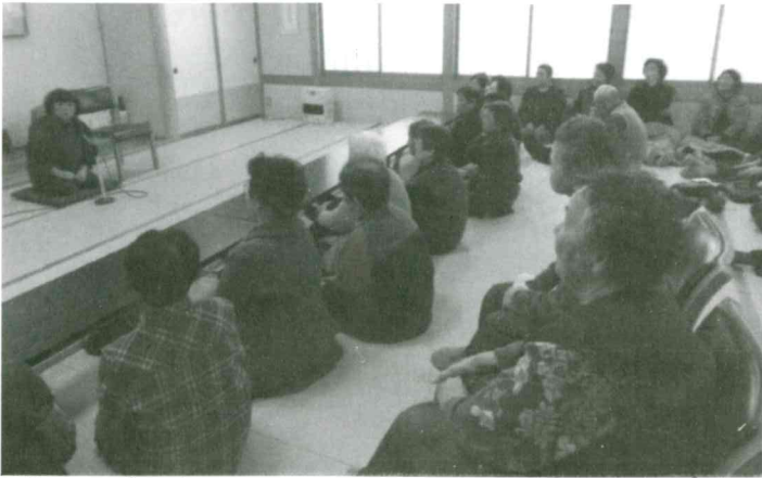
上北目 いきいきサロン 1月16日(土) 午前「輪投げ」を行い、昼食を上北目地区食改の皆さんが作った料理で会食し、午後は「とんと昔語り」を楽しんだ。 参加者 40名