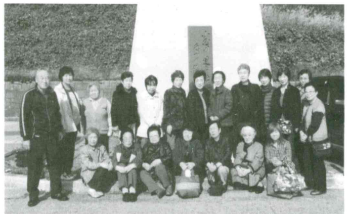
下北目 いきいきサロン 11月7日(土) 谷地「紅花資料館」を見学したあと舟形「若鮎温泉」で入浴と会食を行った。 参加者 21名