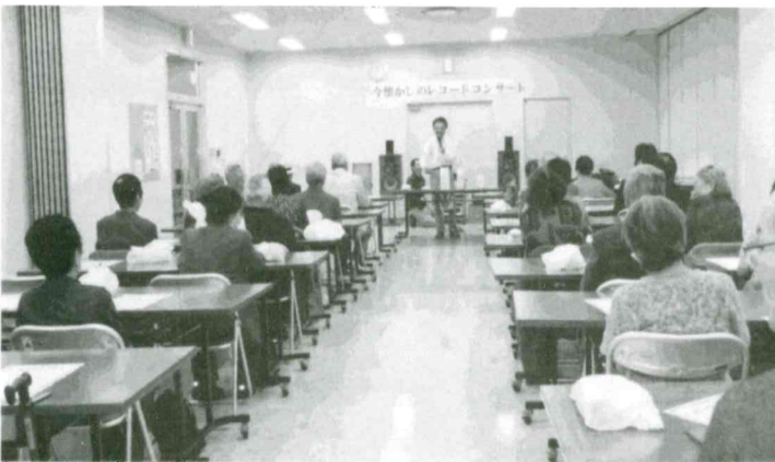
駅西 いきいきサロン 11月15日(日) 懐かしのレコードコンサート懐メロを楽しみ、みんなで若返り脳トレを実施した後会食を行った。 参加者 48名